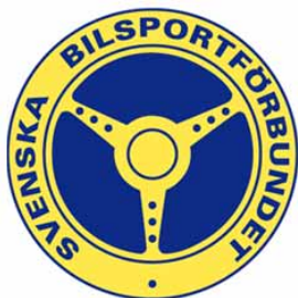
Blå och Gul

Ratten är förbundets huvudlogotyp, den ska användas på Svenska Bilsportförbundets trycksaker av mer officiell karaktär. Den får endast tryckas i någon av följande fyra varianter: