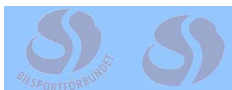
Valfri färg med transparent rand Används med fördel till "ton-i-ton-tryck"