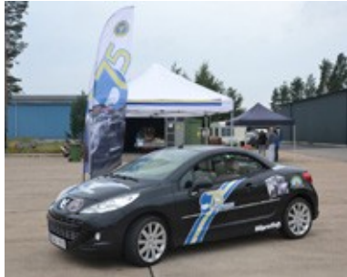
Budkavlebil i Söderhamn

Många trevliga arrangemang har ingått i firandet av SBF:s jubileums år. Distriktet har haft jubileumstävlingar i Söderhamn, Kungsberget i Järbo och Dala-Järna.