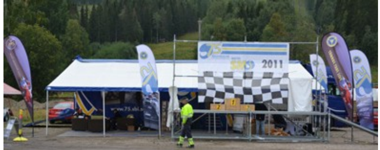
75 års trailer i Kungsberget Järbo