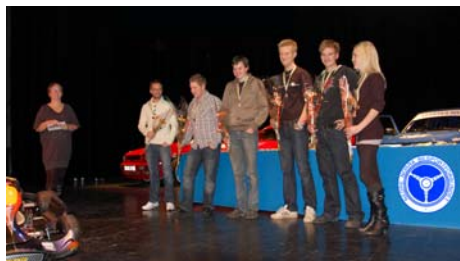
Pristagare i rally FM