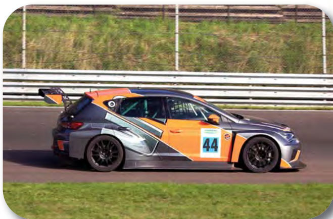
RM vinnaren JL Racing MK Scandia