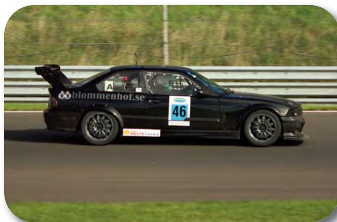
Totalvinnaren och vinnare klass 3 MSLS 2017 Blommenhofracing.se Stockholms Bilklubb

För att summera 2017 så har det varit ett otroligt fint racingår med många positiva tongångar och fina resultat. Under 2017 har vi även varit försko-nade från några allvarliga olyckor och med det hoppas vi att 2018 kommer att bli ett ännu bättre racingår.