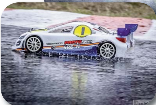
Sverige cupen i 1:10 off-road 2wd och 4wd.