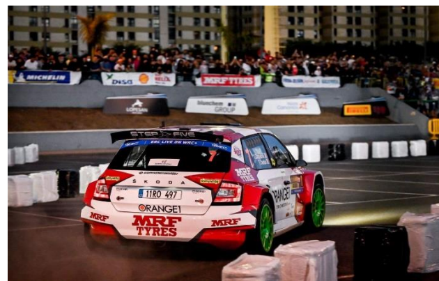
Två gånger hamnade Simone Campedelli i räcket på bergsvägarna, men lyckades ändå bärga en 5:e plats.