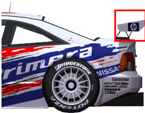
Figur 2 Box 20x20 cm