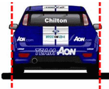
Figur 3 Karossens syftlinjer

2.5 Bilen får ej vara utrustad med dragkrok eller del därav