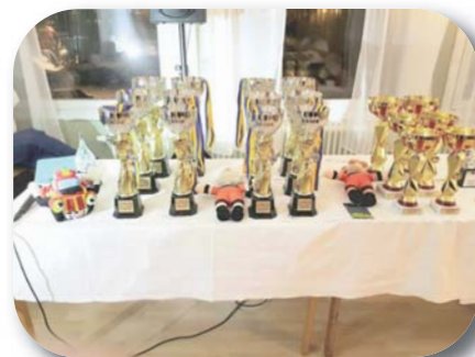
Bilder från prisbordet